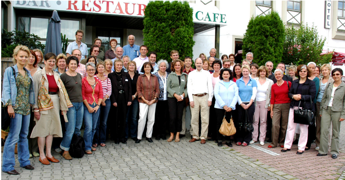
Mitglieder des Qualitätsverbundes Juni 2007 in Augsburg-Aystetten