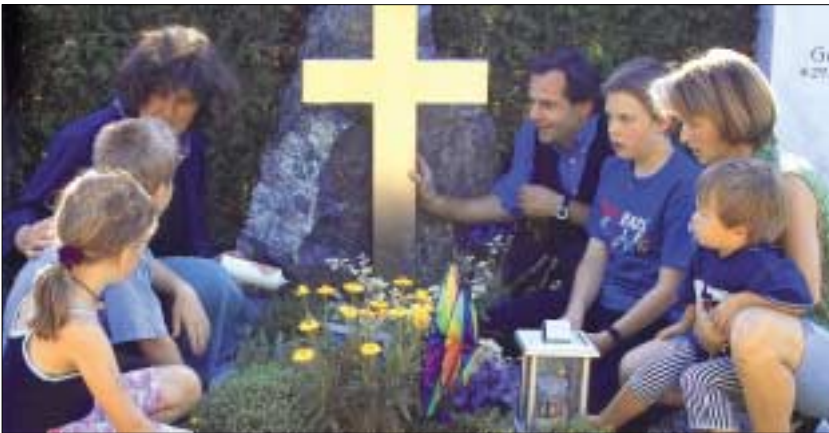
Seelsorgerische Begleitung und Unterstützung kann bei der Trauer um ein verstorbenes Kind helfen.

Insbesondere die Seelsorge kann durch die Kirchen oder Glaubensgemeinschaften gefördert werden. Hierzu zählt beispielsweise die Freistellung von Seelsorgern oder Pfarreien für die Arbeit in schwierigen, lebensbedrohlichen Phasen, die Sterbebegleitung oder die Trauerarbeit.